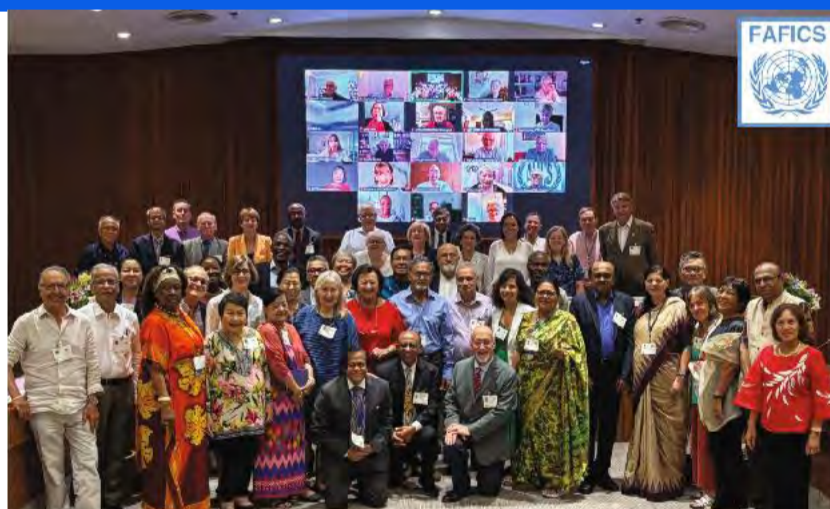
Participants to the 54 th (hybrid) Session of the FAFICS Council, 22-25 July 2024, Bangkok.