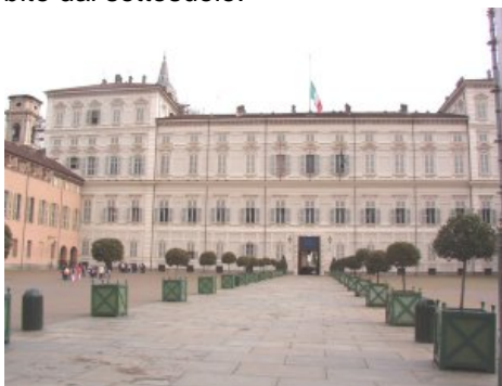
Piazza Castello: Palazzo Reale

Il cuore "bianco" sarebbe nella zona di piazza Castello : i punti di massima concentrazione delle forze positive sarebbero proprio il centro della cancellata e la Mole Antonelliana, che irradierebbe su tutta la città le energie benefiche assorbite dal sottosuolo.