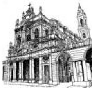
Parrocchia SS. Annunziata

Esiste poi una Torino sotterranea: chilometri di gallerie e cunicoli che un tempo erano arterie vive della città, rifugi di guerra, di carestia in caso di pericolo. Dalla cripta della parrocchia della SS. Annunziata , in via Po, e dai sotterranei di Palazzo Madama accedeva alle cosiddette Grotte Alchemiche, meta di personaggi quali Nostradamus, Paracelso, Cagliostro e il Conte di Saint Germain.