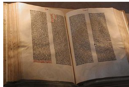
La Bible de Gutenberg

contre les peurs et les calamités engendrées par la guerre, la misère, l'injustice, la maladie, la disette et la sécheresse. La Bible possède un tel pouvoir d'évocation qu'elle est parvenue à convaincre le monde entier que, de tout temps, Jérusalem avait joué un rôle central dans l'expérience de tout l'ancien Israël."