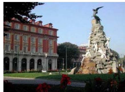
Piazza Statuto: Fontana del Fréjus

il sole. Inoltre in questa zona, dai tempi dei Romani, c'era la " vallis occisorum ", ovvero la necropoli. Proprio in piazza Statuto si trovava il patibolo, che i francesi trasferirono all'incrocio tra corso Regina Margherita e via Cigna, oggi chiamato " rondò dla forca ".