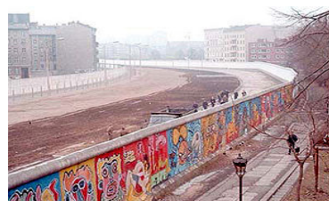
Berlin Wall in 1986

The week passed with a lot of intense work, visits, and discussions and on 23 rd November, as I was preparing to attend a working dinner on the other side of the river, on the hill near Charles Bridge, the phone in my room rang and the Chief of Polytechna asked me to join him in the foyer. His voice was very excited - I went down to the hall and found him holding a bottle of champagne. He told me "Finally, the Berlin Wall is down, come and celebrate with us in the square". There were thousands of people in the square, singing, dancing, drinking - what an evening, what excitement. It seemed that the entire population of Prague was in the streets to celebrate, and the party was not going to end until the small hours of the morning. There was a group of people who were signing up applications to join the " Freedom Forum " and an endless queue waiting to sign up. One of the concerns, however, was that the idea of a united Germany was not greeted with much enthusiasm - too many memories were still lying under the ashes.